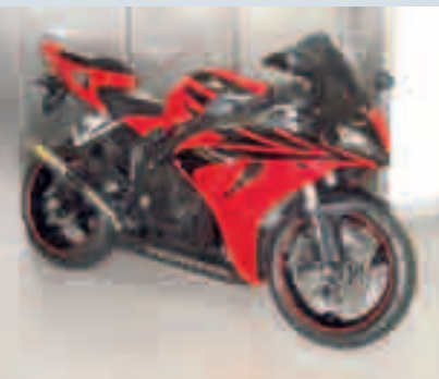
Ein Einzelstück ist die rote Fireblade nach IDM-Vorbild. Wie die Motorräder in der Superbike-Klasse, bietet der Umbau einige technische Besonderheiten: Der

Auspuff „GP Twin Replica“ von Arrow ist aus leichtem und hochfestem Titan gefertigt. Die Kompletanlage mündet in zwei Endtöpfe und verleiht dem Motorrad eigenständigen Klang und Optik. Die Bremsanlage wurde vorn und hinten mit Karbon-Bremsleitungen und Wave-Bremscheiben der Firma Braking verfeinert. Die Fußrastenanlage von Gilles in schwarzer Ausführung ist verstellbar und lässt sich so für die Bedürfnisse des Fahrers individuell anpassen. Eine Verklei-