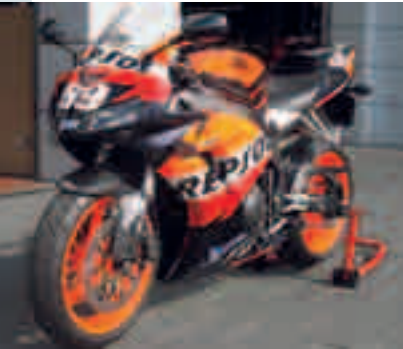
Der Titel der MotoGP ist wieder in Honda-Hand. Nicky Hayden triumphierte

Fugel Sport zeigt zwei ganz unterschiedliche Wege, wie die 172 PS starke Fireblade zum Einzelstück wird.